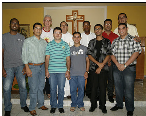
Noviciado Interprovincial em Campina Grande-PB - 2012